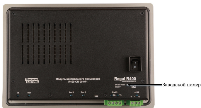
б) вид сзади