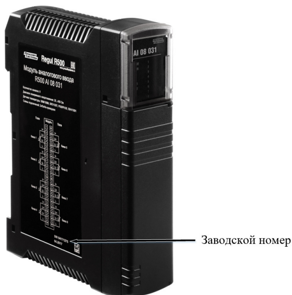
Рисунок 3 – Общий вид модулей REGUL R500