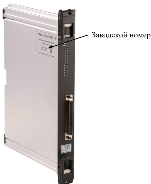
Рисунок 4 – Общий вид модулей REGUL R600

Заводской номер контроллеров, состоящий из восьми арабских цифр, печатается в паспорте контроллеров и наносится методом лазерной гравировки на боковую часть корпуса контроллеров REGUL R200, REGUL R500, REGUL R600 и на заднюю часть контроллера REGUL R400. Места расположения заводского номера указаны на рисунках 1 – 4.