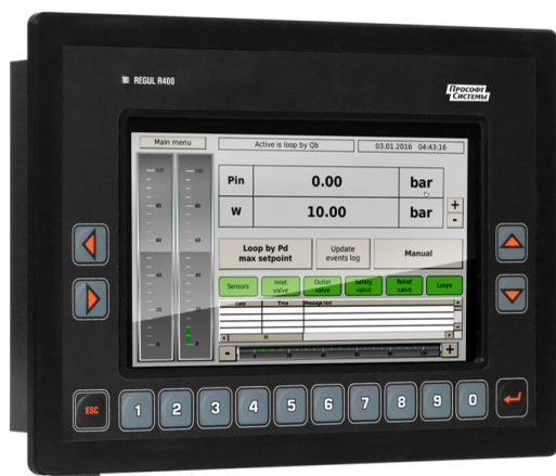
а) вид спереди